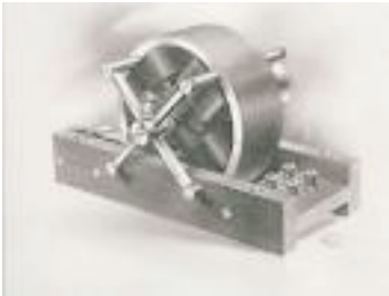
Tesla electric motor