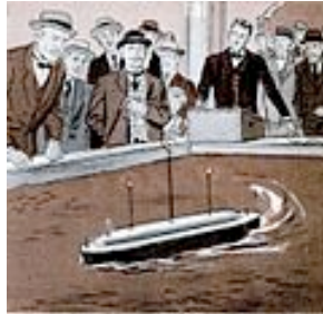
Radio controlled boat